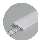
Schermo opaco 2 mt